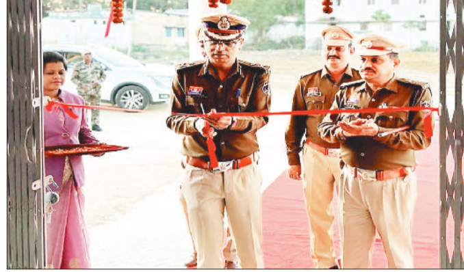
ऑफिसर्स मेस का शुभारंभ करते आईजी।