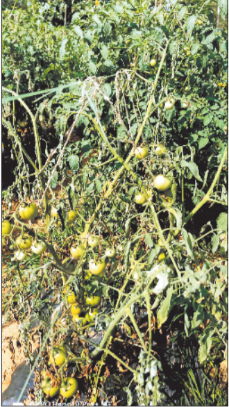
ठण्ड से झूलसी टमाटर की फसल।

शहर सहित पूरे सरगुजा संभाग में पिछले एक सप्ताह से कड़ाके की ठंड पड़ रही है। पशुधर्म की सर्द हवाओं के प्रभाव से पारा सामान्य से 4.5 डिग्री नीचे पहुंच गया है तथा न्यूनतम पारा प्रारंभ से ही 5 डिग्री पर स्थिर है। कड़ाके की ठंड के कारण कई स्थानों पर रात में धुंध एवं कोहरा का असर देखा जा रहा है वहीं पटारी क्षेत्रों में लगातार पाला जम रहा है। जिसके प्रभाव से फसलों पर विपरीत प्रभाव पड़ रहा है। हाल-हाल तक कुपकों को अच्छी आय देने वाली टमाटर की फसल पाला के प्रभाव से अब सूख रही है। सरगुजा संभाग में टमाटर की व्यापक स्तर पर खेती होती है। अच्छी कमाई होने के कारण बड़ी संख्या में किसान पटारी क्षेत्रों में टमाटर की खेती कर रहे हैं। पटौसी राज्य यूपी, बिहार एवं झारखण्ड में टमाटर की अच्छी मांग होने के कारण व्यापारी सीधे